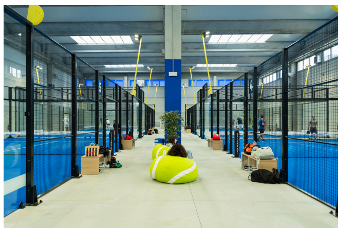
7 campi panoramici

Ermes Padel SSD Srl Viale Certosa. 138, 20156 Milano P.IVA 11564810965