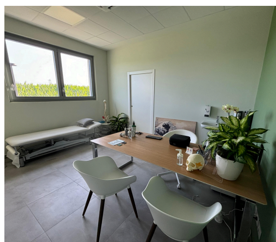
Studio Osteopata e Nutrizionista