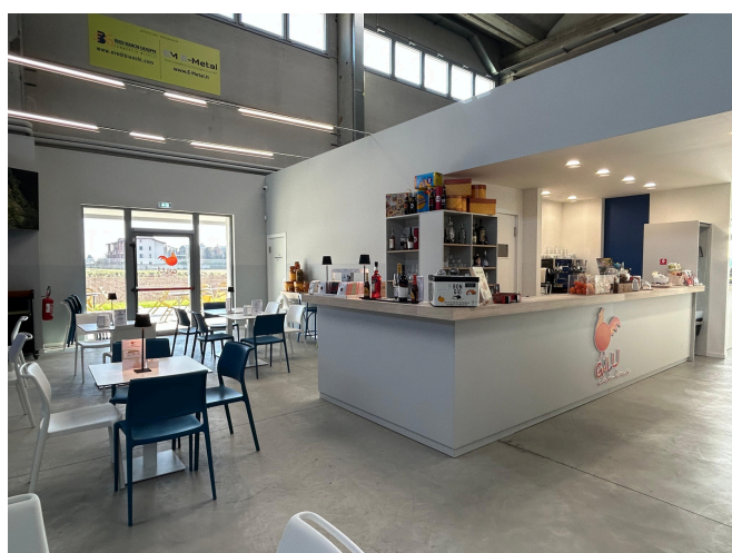
Caffetteria, snack bar, pizzeria